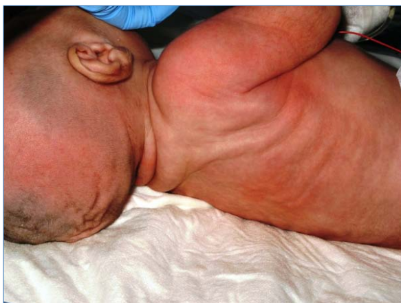
Figura 1. Aspecto distrófico con lesiones nodulares a nivel costal.

A su llegada a urgencias el paciente presenta un aceptable estado general con una deshidratación clínicamente moderada. En la exploración física destaca una induración difusa y dolorosa en espalda, glúteos y zona proximal de las extremidades. En la cara, zona mandibular y tronco, asocia entre 20 y 30 nódulos subcutáneos de 0,5 x 1 cm no eritematosos y de consistencia dura (Figura 1). En la analítica sanguínea destacan unos niveles plasmáticos muy elevados de calcio de 21,9 mg/dL (calcio iónico de 5,7 mg/dL). Ante los diagnósticos de hipercalcemia, deshidratación y la presencia de placas subcutáneas, se sospecha de NGS e hipercalcemia secundaria. Se realizan un ECG, objetivándose una importante depresión del segmento ST (Figura 2) y una ecocardiografía donde se observa una alteración de la relajación del ventrículo izquierdo, sin otros hallazgos. La ecografía renal evidencia nefrocalcinosis que persiste al alta. Ingresa en UCIP para monitorización e inicio del tratamiento. Ante la elevada concentración plasmática de calcio que obligaba a iniciar el tratamiento sin demora y la falta de consenso en el tratamiento de la hipercalcemia secundaria a NGS en la bibliografía, se decidió tratar según la pauta habitual en nuestro servicio que consiste en hiperhidratación, furosemida y corticoides.